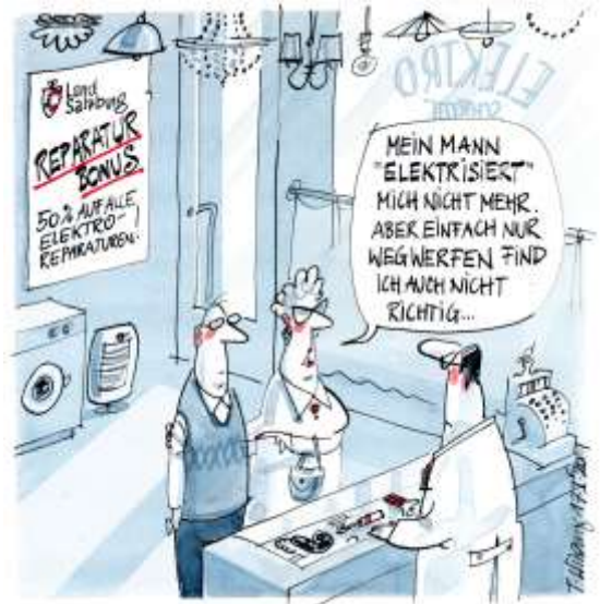
Karikatur: Thomas Wizany

Die Rechnung des Reparaturbetriebes (Rechnungsdatum ab 19.11.2019, der Mindestbetrag muss bei € 40,- liegen) und den Zahlungsnachweis oder den Beleg aus der Registrierkasse. In der Regel werden 50 % der Rechnungssumme gefördert. Der Maximalbetrag liegt jedoch bei 100,- Euro pro Haushalt und Jahr. Im schnellsten kann das Förderansuchen per eGovernment auf https://www.salzburg.gv.at/reparaturbonus gestellt werden.